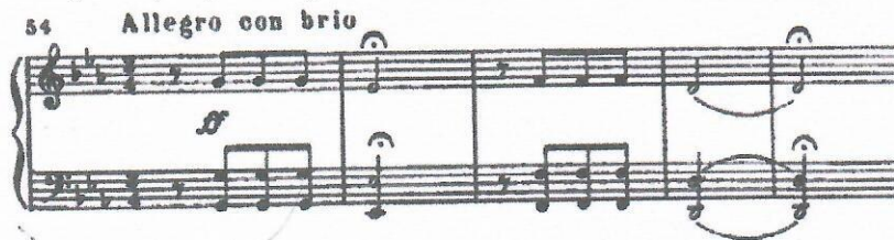
Таблица для выполнения задания 1: