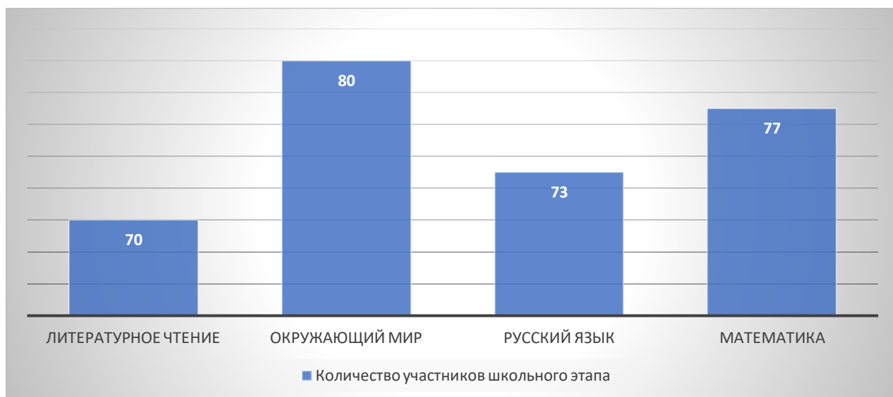
Таблица 1. Проходные баллы на муниципальный этап олимпиады младших школьников в 2020-2021 учебном году